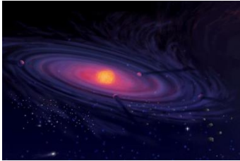
Representación artística de un disco protoplanetario